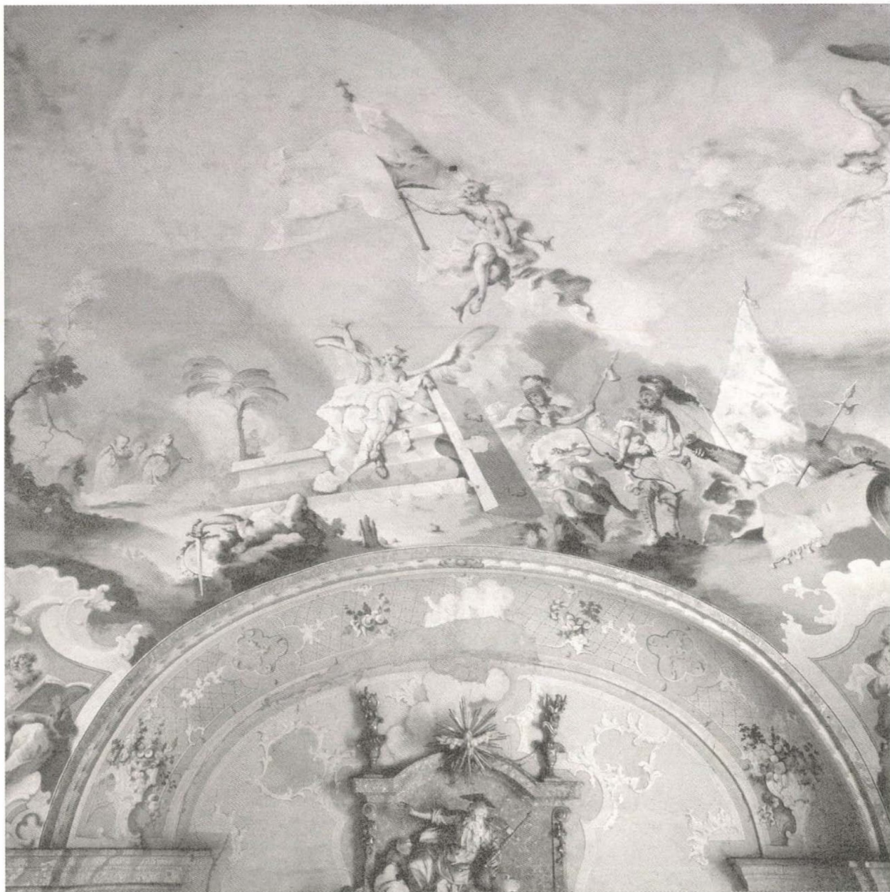
5. Lieb Ferenc: A Feltámadás. A monoki Andrásy-kastély kápolnájának mennyezetképe, 1770

függönnyel, puttóval (talán az ágy helye?). Ebből a szobából ajtó nyílt, s nyílik ma is „Mlgos Grófné Öltöző Szobájába” – szinte romos a sok átalakítástól –, ahol a négy világrész allegóriái láthatók a mennyezet sarkaiban, középen festett lanterna-nyílás, alattuk íves-tükrös lila falmezők, illetve a lunettákban fáklya és hattyú, az ablakbélletekben pedig egy-egy medalion, bennük grisaille arc.