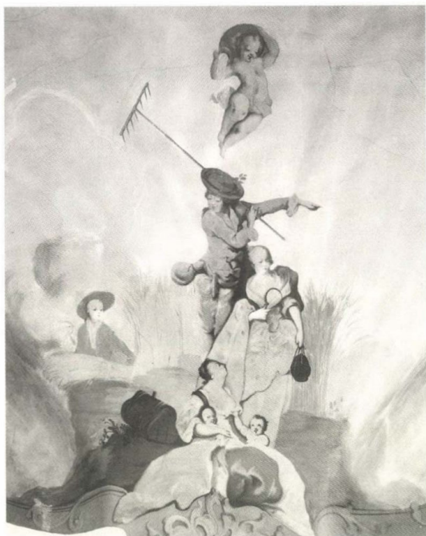
2. Lieb Ferenc: A nyár. Az edleyni kastély falképének részlete, 1769–1770.