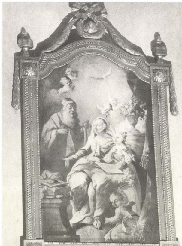
8. Lieb Ferenc: Mária neveltetése, 1769. Abasár, rk. plébániatemplom