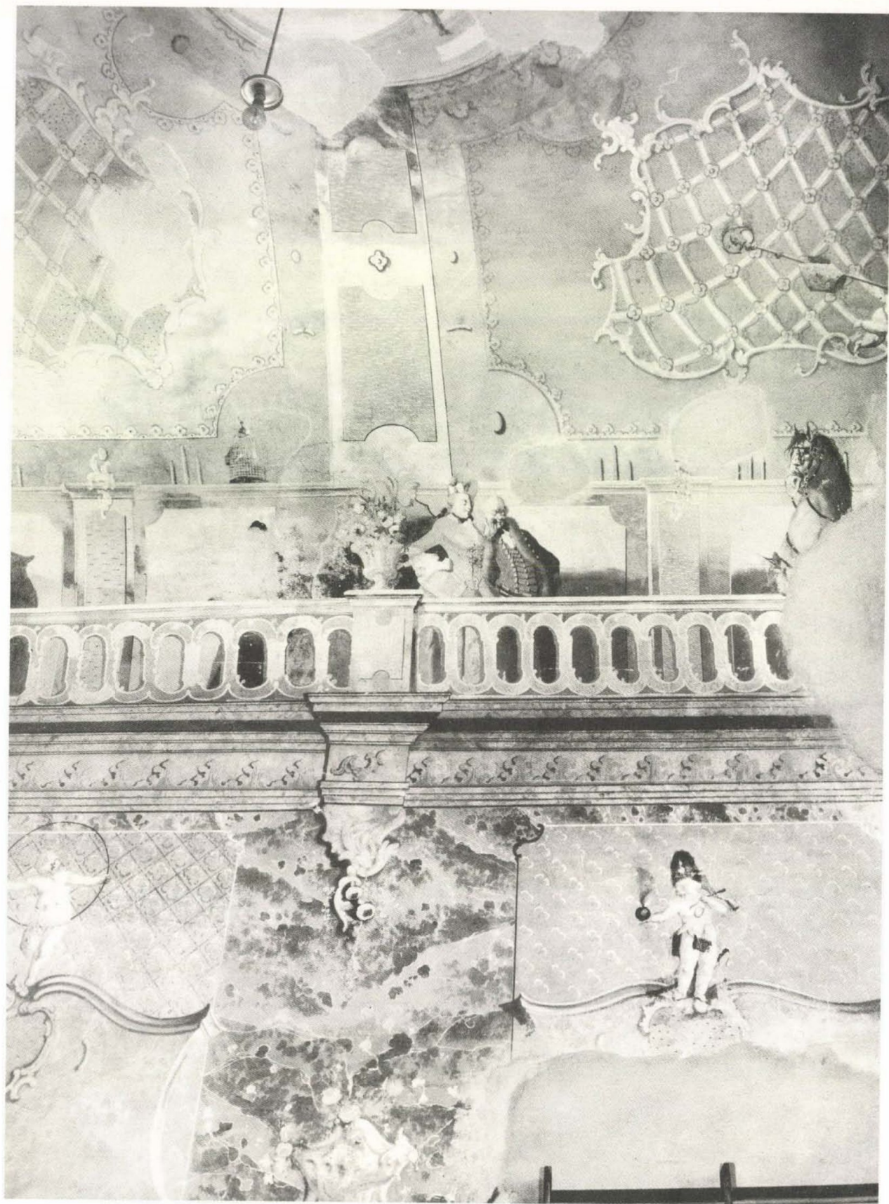
4. Lieb Ferenc: Főútri pár, a levegő és a tűz allegóriája. A monoki Andrásffy-kastély falképének részlete, 1770–1771