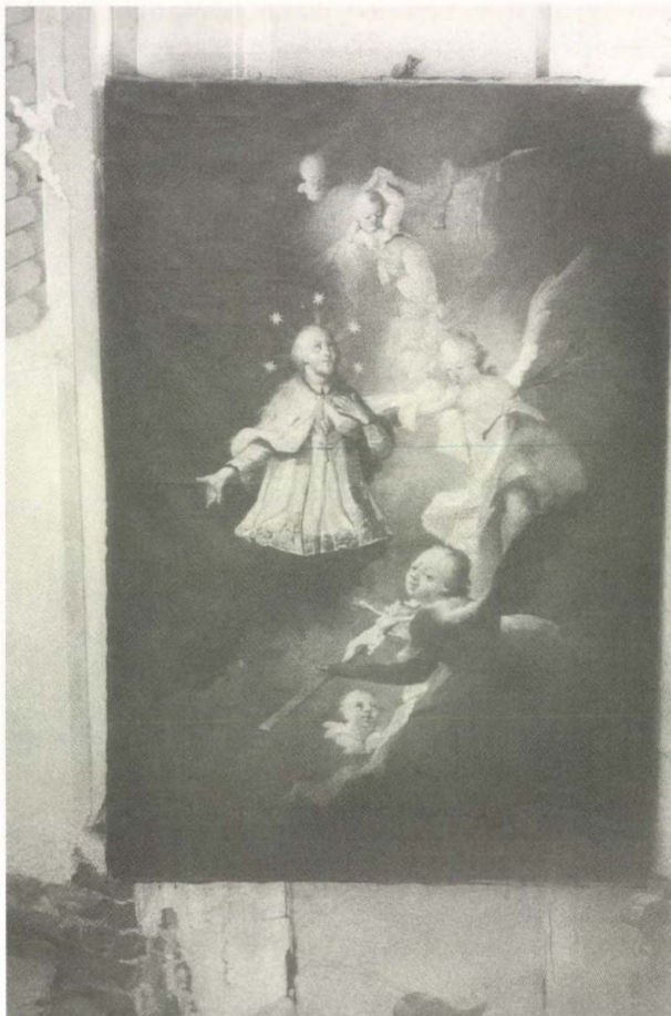
6. Lieb Ferenc: Nepomuki Szent János. Oltárkép a monoki Andrassy-kastély kápolnájában, 1770

göző ereje nem is, a kastély életének pompáját, a szándékolt idillt visszatükröző, mintegy megduplázó, ezzel mégiscsak reprezentáló hatása lehetett ennek a látszatvilágnak, amely több falképegyüttesről is ismert Északkelet-Magyarországon.