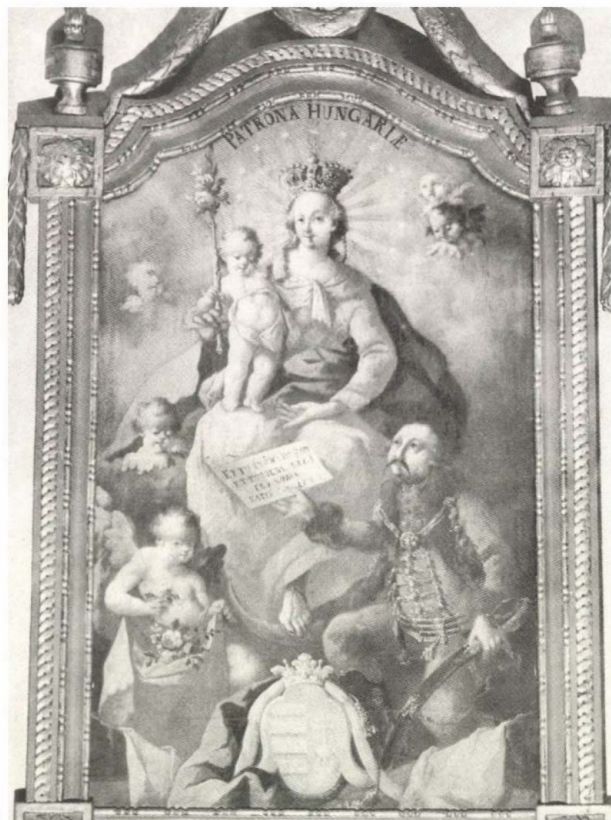
7. Lieb Ferenc: Patrona Hungariae, 1769. Abasár, rk. plébániatemplom

Most már az is bizonyos, hogy „Miskolcon is dolgo- zott az edelényi kastély freskőfestője”, ahogyan azt még 1958-ban hírül adta Szendrey Zoltán saját forráskutatásai