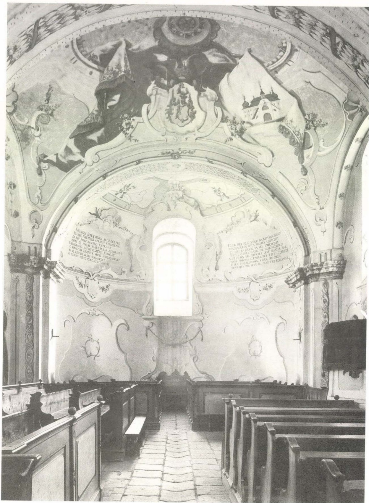
14. Lieb Ferenc: A taktabáji református templom kifestése, 1784. Részlet az apszissal, a Patay-címerrel és a báji Patay-kastély képével. Archív felvétel